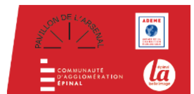
Illustration Matière Grise : Bonnefrite

Entrée libre. Inscription obligatoire : contact.economie@agglo-epinal.fr