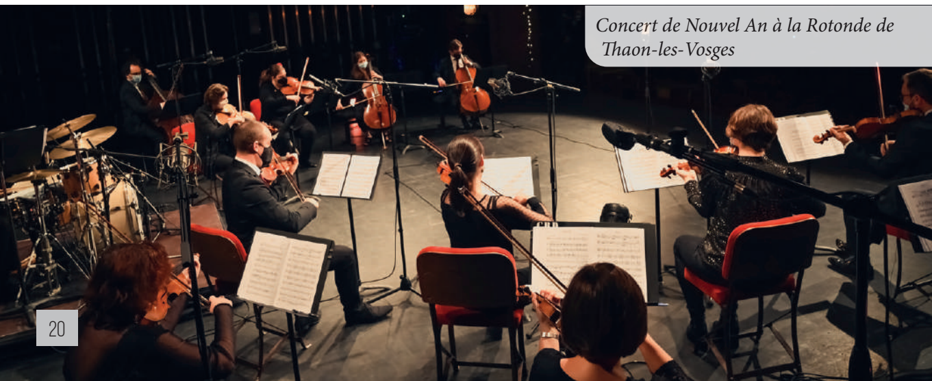
Concert de Nouvel An à la Rotonde de Thaon-les-Vosges

Le Conservatoire à rayonnement départemental a débuté sa saison artistique le 30 novembre 2021 par un concert jazz et poursuit avec le traditionnel concert des lauréats, où les diplômés de deux années sont récompensés.