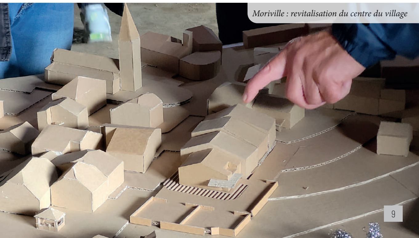
Morville : revitalisation du centre du village