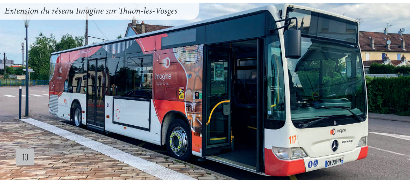
Extension du réseau Imagine sur Thaon-les-Vosges