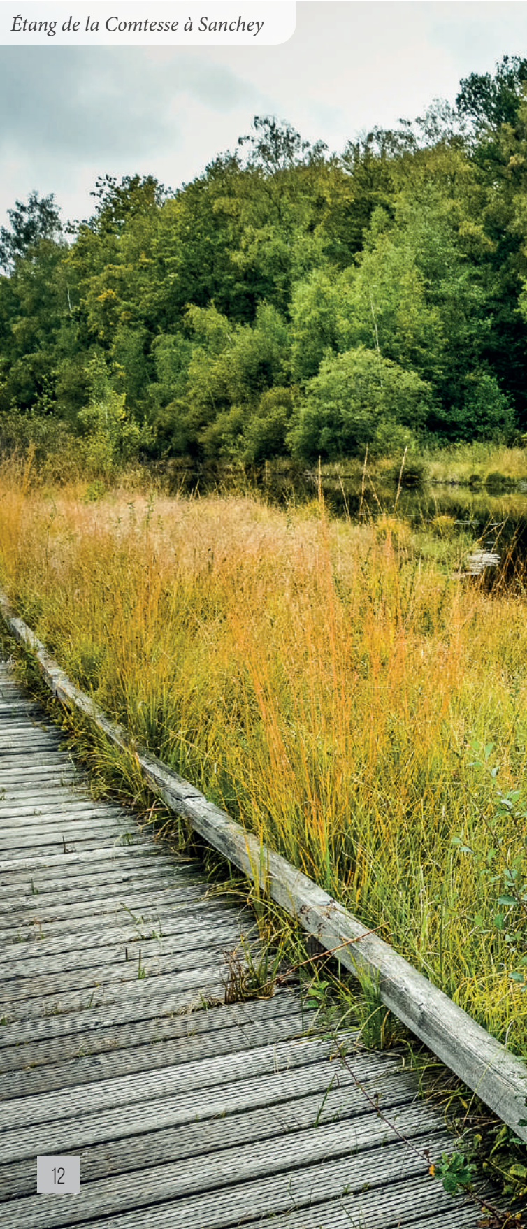
Étang de la Comtesse à Sanchev