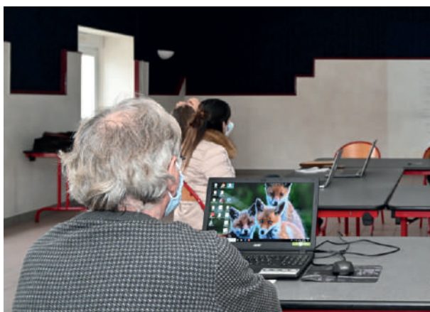
Cours informatique à Le Clerjus

Animation d'ateliers « Je fabrique mes produits maison » et création puis diffusion d'un livret de recettes auprès des familles, des bénéficiaires du RSA, d'agents de l'agglomération (bmi, référentes RSA) et du grand public lors de plusieurs manifestations sur le territoire.