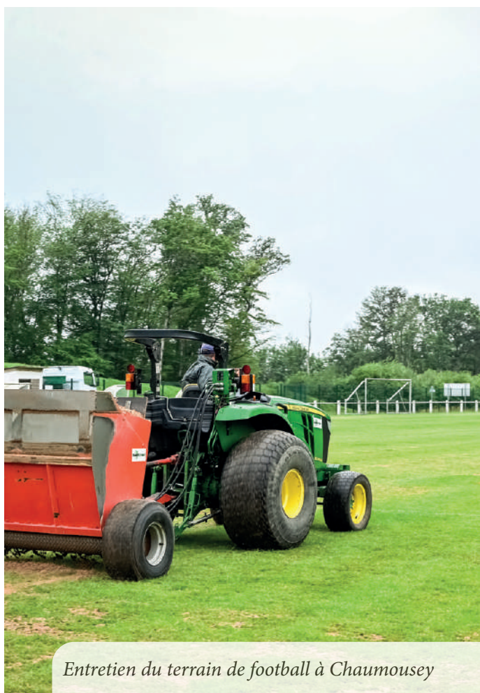
Entretien du terrain de football à Chaumousey

Engagement des organisateurs dans une démarche de développement durable : tri des déchets, actions de sensibilisation