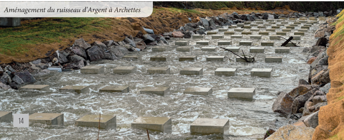
Aménagement du ruisseau d'Argent à Archettes

Contrôle du raccordement au réseau d'assainissement collectif des 140 immeubles raccordables à Socourt. En 2018, la commune avait réalisé d'importants travaux relatifs à la création d'un système complet d'assainissement collectif des eaux usées (station d'épuration et réseau de collecte). Les habitants avaient