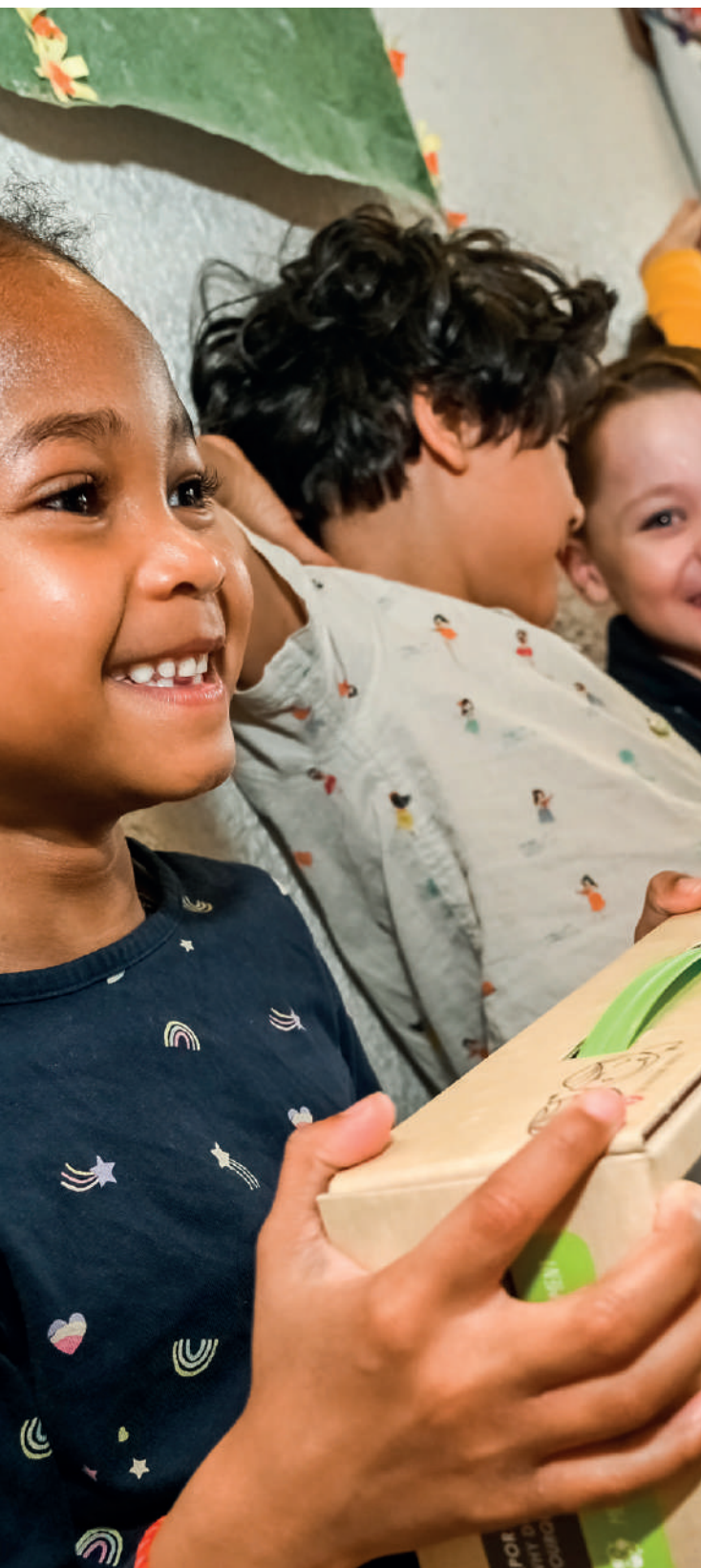
Remise de prix du concours Watty à Châtel-sur-Moselle