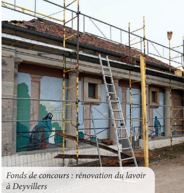
Fonds de concours : rénovation du lavoir à Deyvillers

Mobilisation des fonds de concours par 26 communes de moins de 2 000 habitants pour la réalisation d'équipements et pour un montant total de 169 000 €.