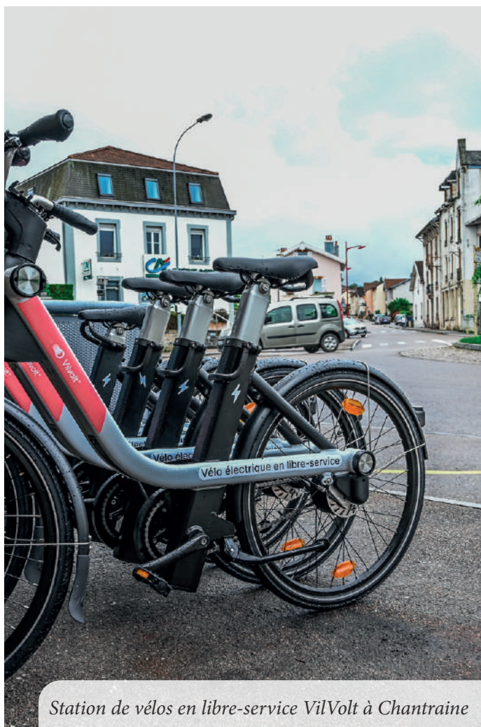
Station de vélos en libre-service VilVolt à Chantraine

Lancement, en novembre 2021, du système de covoiturage avec l'application KLAXIT qui met en lien les covoitureurs pour leurs trajets domicile-travail . La collectivité cofinance les trajets : chaque conducteur gagne au minimum 2€ par trajet et par passager. Pour ces derniers, les déplacements sont gratuits. Deux mois après le lancement, 620 personnes étaient inscrites sur l'application et 794 trajets ont été réalisés, soit 24 000 km parcourus et 2,7 tonnes de CO 2 évitées.