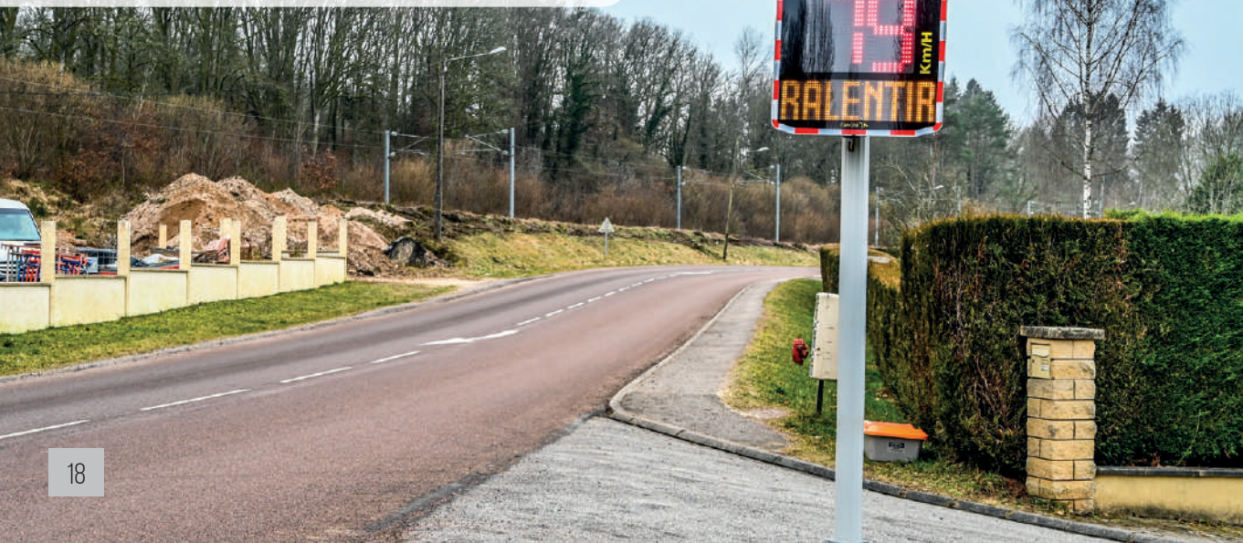
Fonds de concours : sécurisation du centre de Dinozé