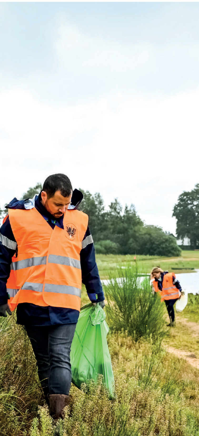
Ramassage des déchets sur les rives du lac de Bouzey

Les chapitres de la charte s'articulent selon les axes du Plan Climat. Les principes suivants ont été validés par les élus du Bureau Communautaire le 6 septembre 2021.